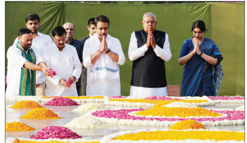
उपराष्ट्रपति जगदीप धनखड़ के साथ जयंत चौधरी ने नई दिल्ली के किसान घाट पर पूर्व प्रधानमंत्री चौधरी चरण सिंह की पुण्यतिथि पर उन्हें पुष्पांजलि अर्पित करते हुए।

टीएम एक्शन इंडिया नई दिल्ली: केंद्रीय मंत्री जितेंद्र सिंह ने कहा कि प्रधानमंत्री नरेंद्र मोदी ने जाति या धर्म की परवाह किए बिना समान सार्वजनिक सेवा वितरण सुनिश्चित किया। इसके अलावा पिछली सरकार की तुष्टीकरण की संस्कृति को समाप्त कर दिया है। प्रधानमंत्री के नेतृत्व में केंद्र ने यह सुनिश्चित किया कि सभी पात्र लोगों को विभिन्न सरकारी योजनाओं का लाभ मिले। जब सरकारी योजनाओं का लाभ पात्र लाभार्थियों तक पहुंचाने की बात आती है तो किसी के साथ कोई भेदभाव नहीं किया जाता है।