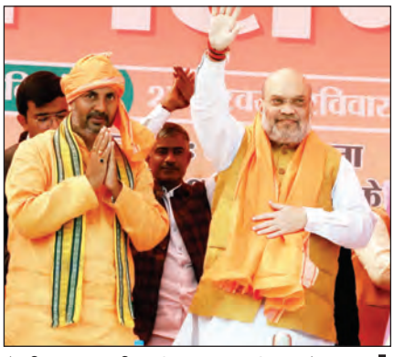
केंद्रीय गृह मंत्री अमित शाह बलिया में चुनाव प्रचार करते हुए।